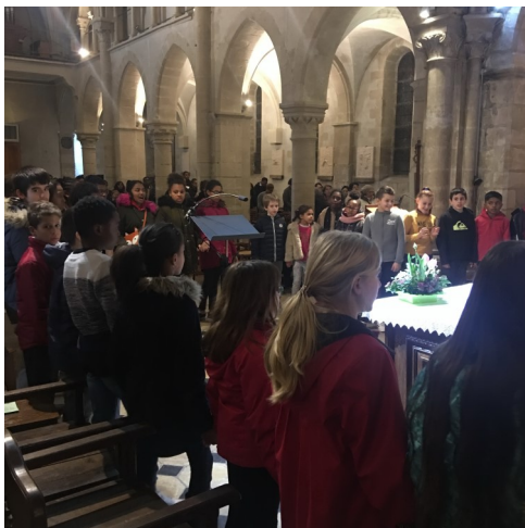
Messe des familles Samedi 16 février

Nous sommes invités à être miséricordieux comme notre Père est miséricordieux. La miséricorde du Christ sur la croix, qui pouvait pardonner à ses meurtriers, nous rap-