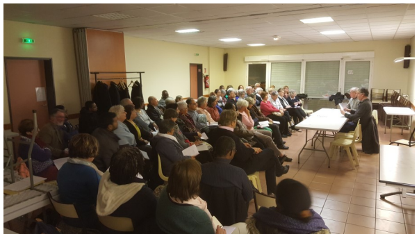
Rencontre élargie de l'Équipe Pastorale de Secteur par rapport aux scandales dans l'Église (4 avril)